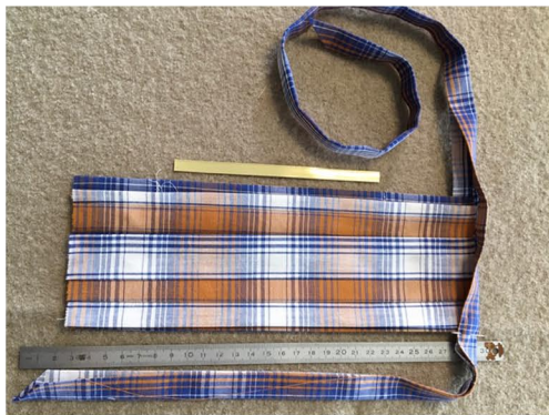
Band und Maske zusammen nähen