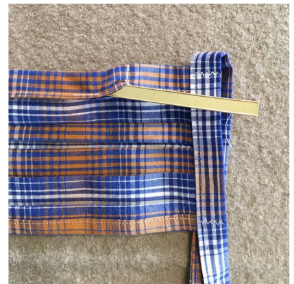
Nasendclip in den Saum schieben