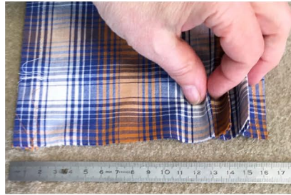
je 3 Falten oben und unten bügeln