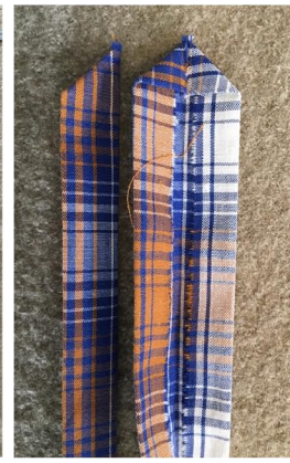
ca. 85 x 8 cm 2 Stück