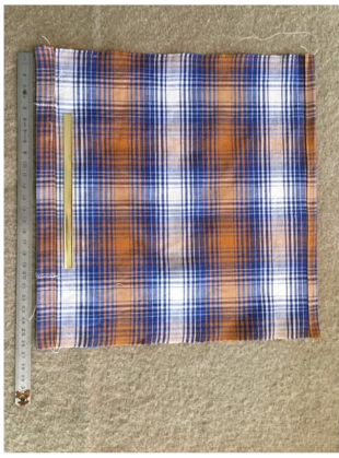
ca. 25 x 25 cm